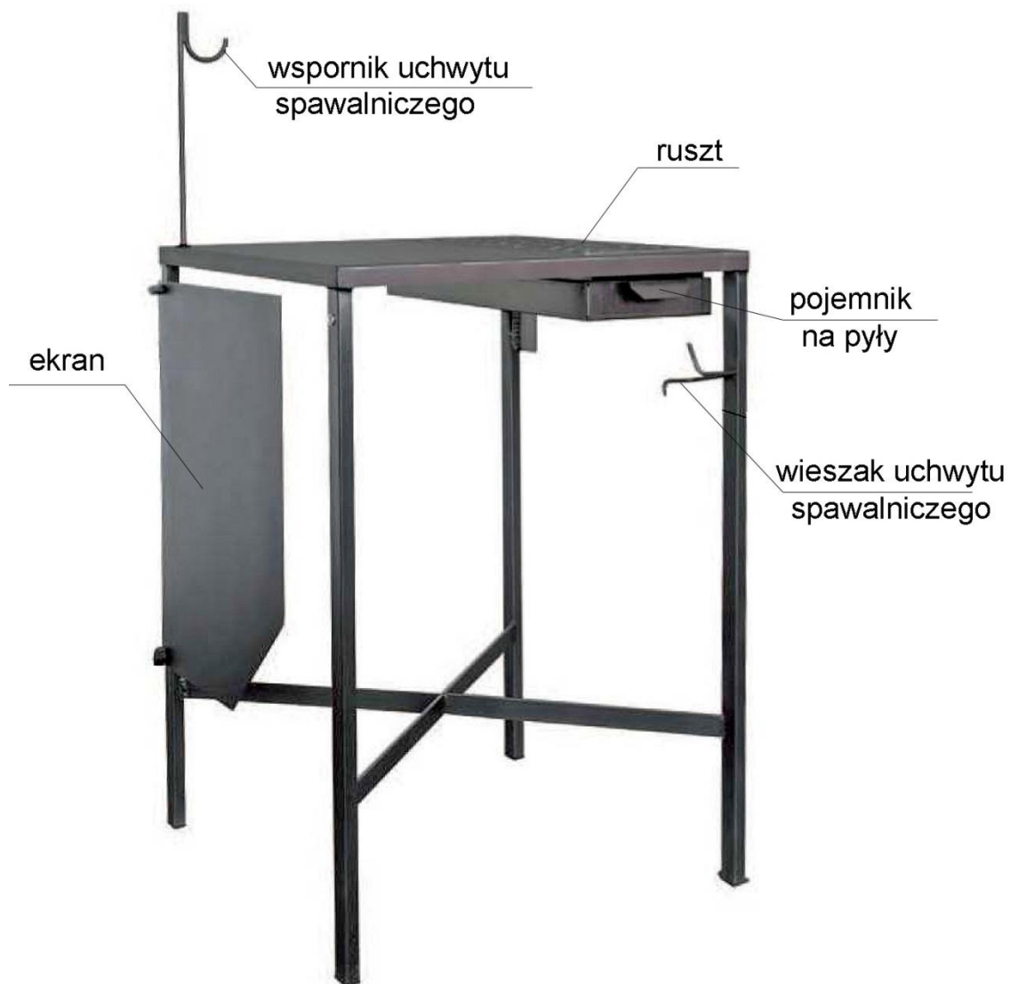
Rys. 1 Opis budowy stołu warsztatowego typu ERGO-STW-S-MINI